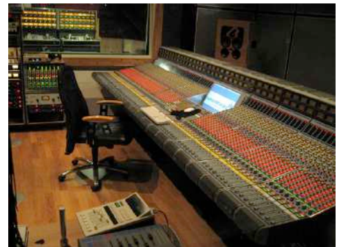
12. April 2014 um 22:26:46