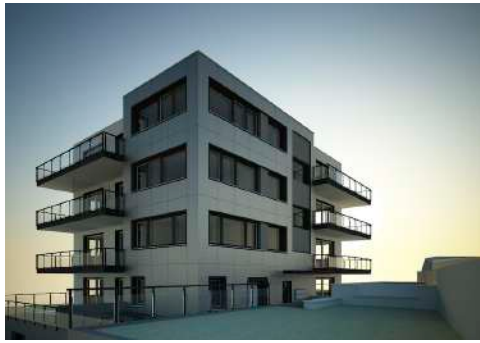
19. Juni 2013 um 09:45:12