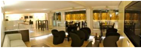
1. Juli 2007 um 22:27:54