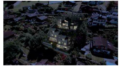
15. April 2019 um 11:50:25