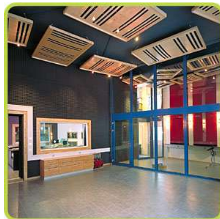
14. Mai 2008 um 18:02:56