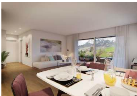
4. Mai 2020 um 12:58:27