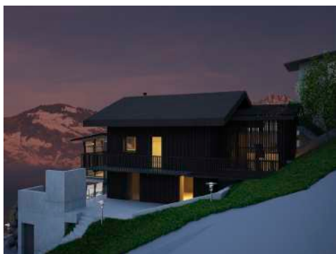
3. Januar 2018 um 19:20:58