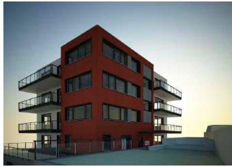
19. Juni 2013 um 10:50:52