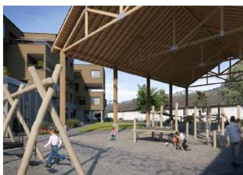
4. Mai 2020 um 13:00:15