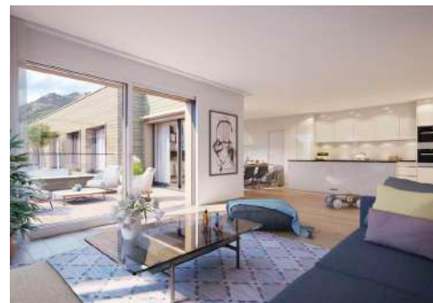
4. Mai 2020 um 12:58:02