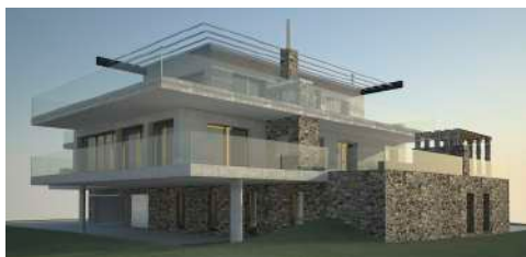
20. Februar 2013 um 10:19:55