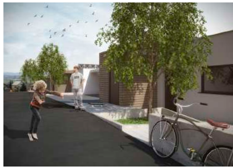
3. Januar 2018 um 19:15:04