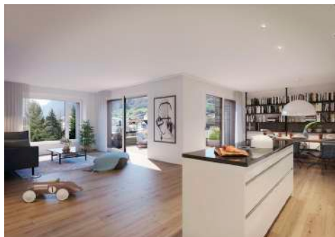
4. Mai 2020 um 12:57:30