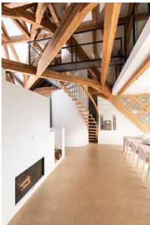
25. Juli 2019 um 16:33:26