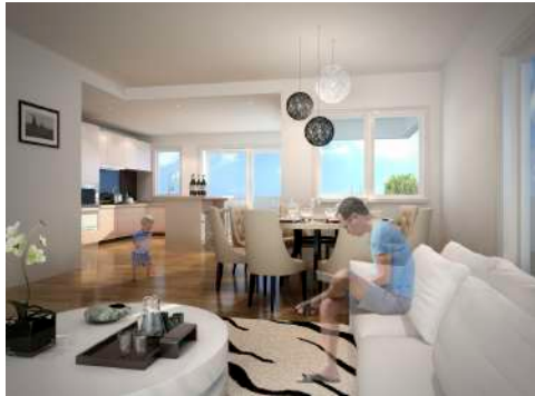
7. März 2015 um 23:49:11