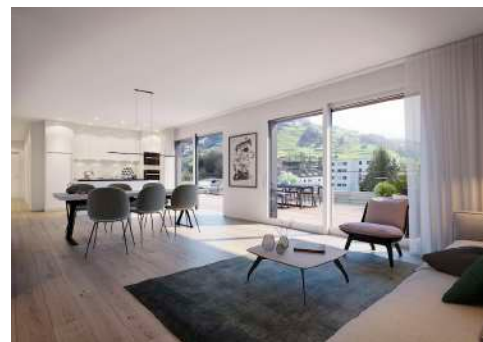
4. Mai 2020 um 12:56:31