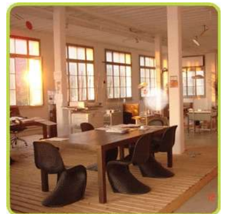
20. Mai 2008 um 14:18:58