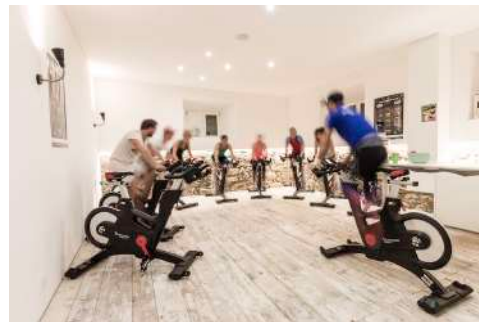
26. Oktober 2016 um 19:44:19