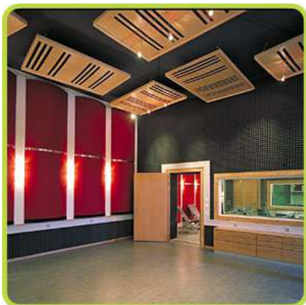
14. Mai 2008 um 18:02:56