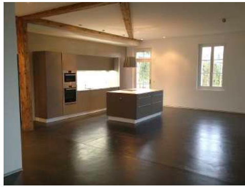
23. November 2011 um 16:09:56