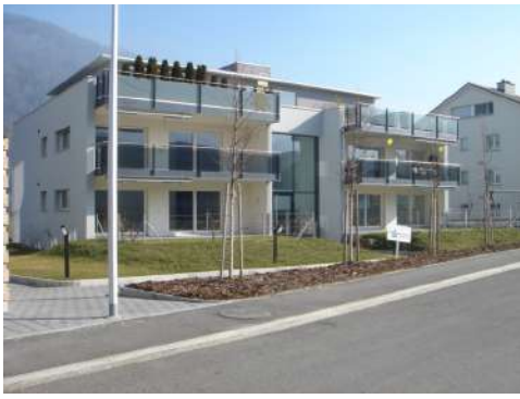
18. Februar 2008 um 12:16:10