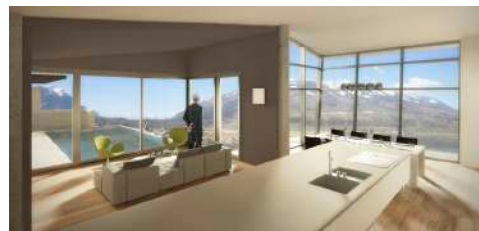
3. Januar 2018 um 19:21:18