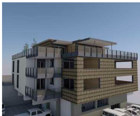
7. Juli 2016 um 13:24:05