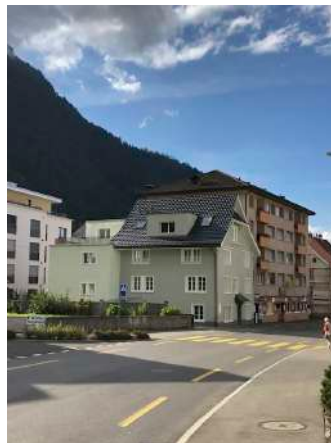
30. September 2019 um 16:14:06