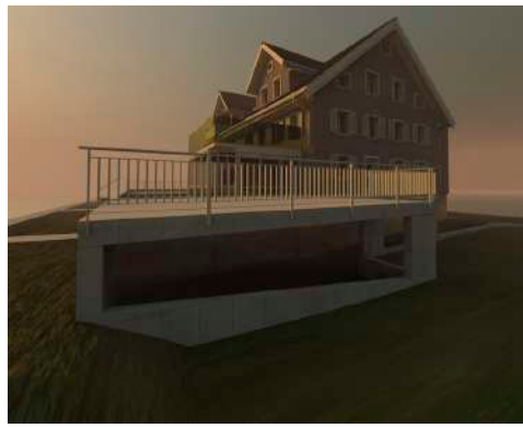
30. April 2019 um 20:54:21