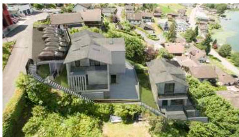
5. Juni 2017 um 16:18:50