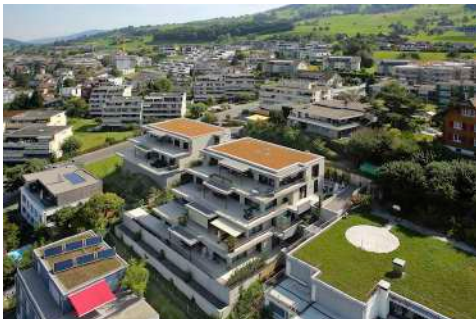
11. Oktober 2021 um 11:46:43