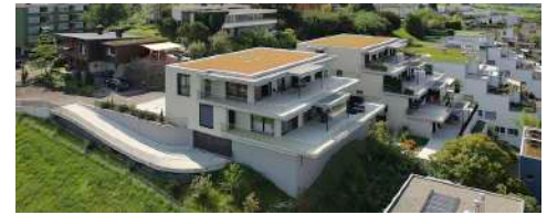
11. Oktober 2021 um 11:45:59