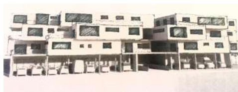
16. August 2017 um 16:18:46