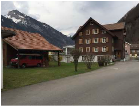
9. April 2018 um 18:29:35