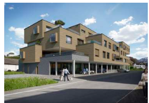
4. Mai 2020 um 12:54:33