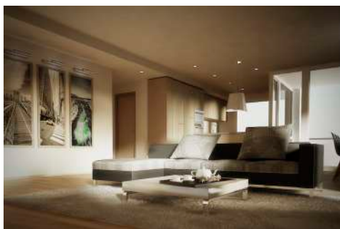
18. Januar 2013 um 13:07:25