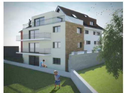
12. März 2015 um 18:59:20