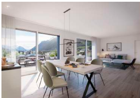
4. Mai 2020 um 12:57:04