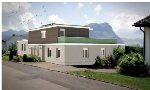
3. Januar 2018 um 19:22:54