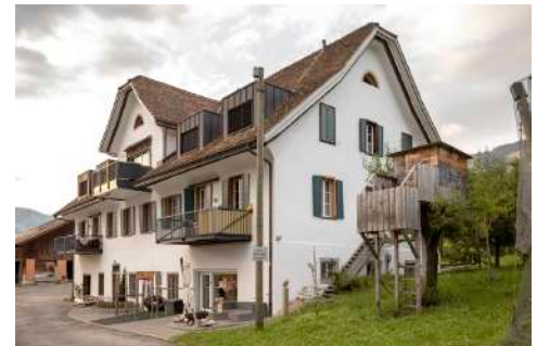
30. Juli 2019 um 19:26:22