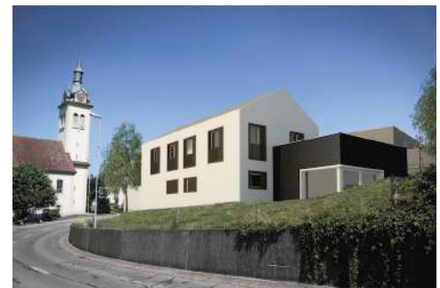
14. Januar 2014 um 13:52:04