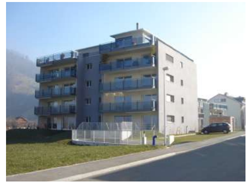
18. Februar 2008 um 12:14:54