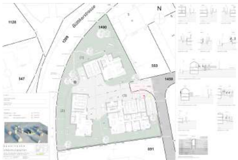
5. Juni 2013 um 10:28:34