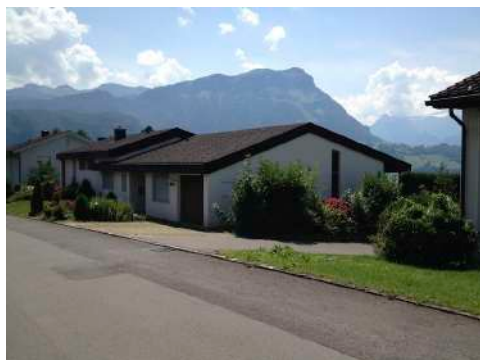
3. Januar 2018 um 19:23:42