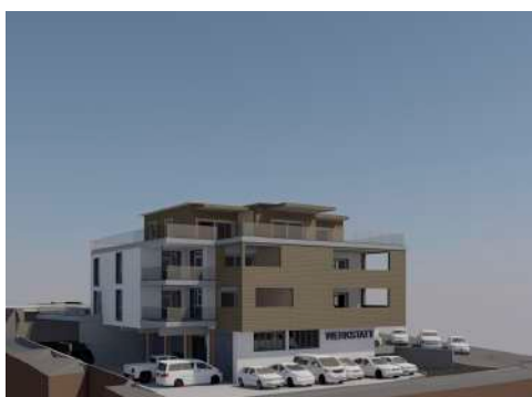
22. September 2015 um 18:28:39