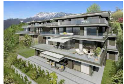
3. Januar 2018 um 19:12:12