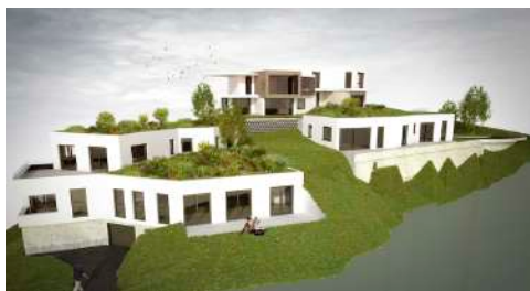
29. Mai 2015 um 08:07:47