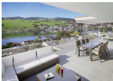
3. Januar 2018 um 19:12:30