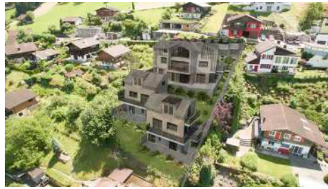
5. Juni 2017 um 16:17:13