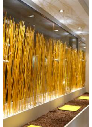
20. Mai 2007 um 23:06:37