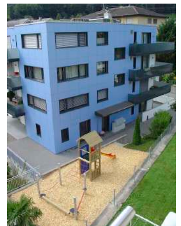
6. Juni 2003 um 18:48:19