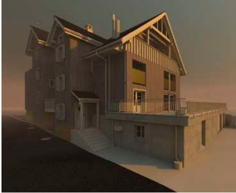
30. April 2019 um 20:55:23