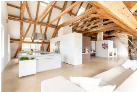
25. Juli 2019 um 15:40:42