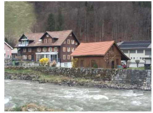
9. April 2018 um 18:32:24