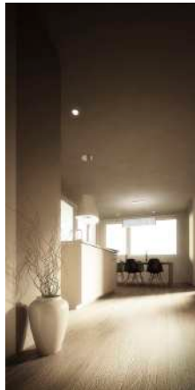
18. Januar 2013 um 14:45:55