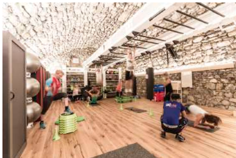
26. Oktober 2016 um 19:29:44