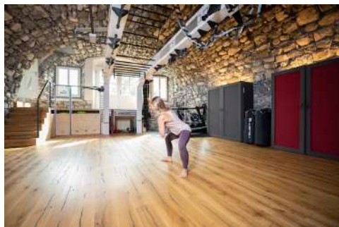
25. Juli 2019 um 17:06:52