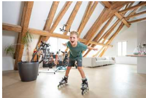
25. Juli 2019 um 16:10:11