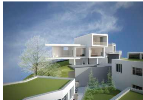
30. Januar 2015 um 10:35:53