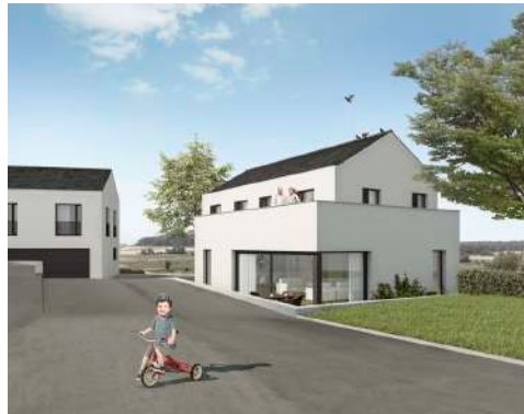
3. Januar 2018 um 19:18:39