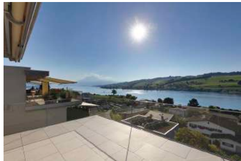
11. Oktober 2021 um 11:46:57