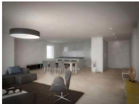
3. Januar 2018 um 19:19:37