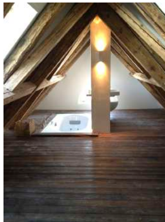
22. Februar 2012 um 14:59:46