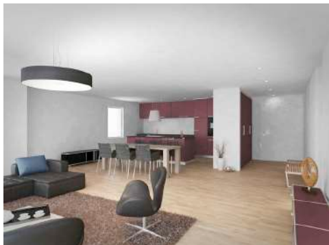
3. Januar 2018 um 19:19:50