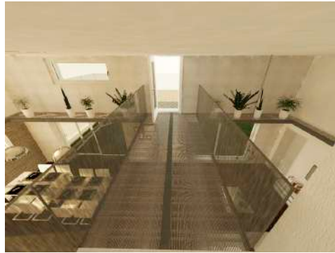
23. Mai 2019 um 14:45:30