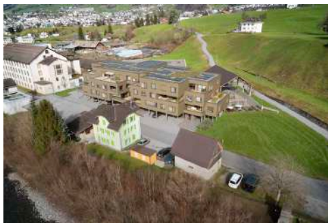
4. Mai 2020 um 12:55:08