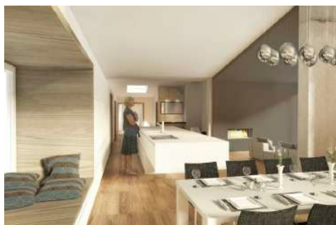
3. Januar 2018 um 19:21:51