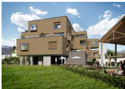
4. Mai 2020 um 12:56:05