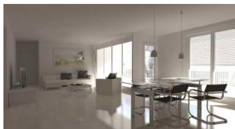
16. Mai 2008 um 18:38:04