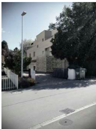
21. Mai 2013 um 21:03:13