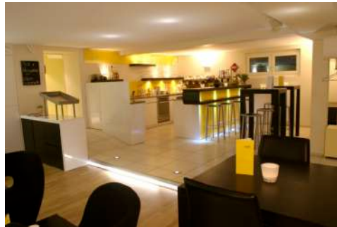
20. Mai 2007 um 22:12:16