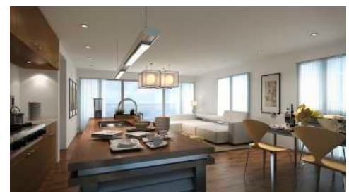
3. Dezember 2015 um 11:25:25