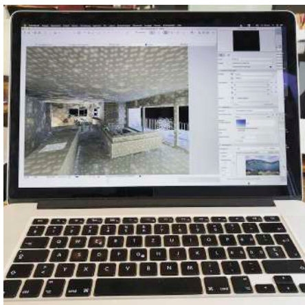
16. April 2019 um 08:40:48