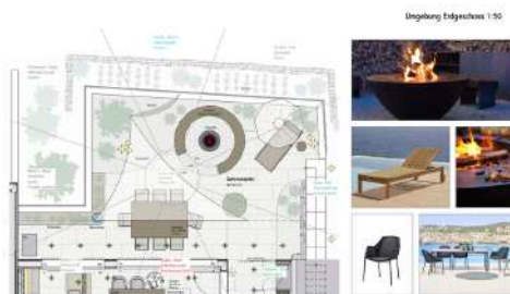
11. Oktober 2021 um 09:31:44