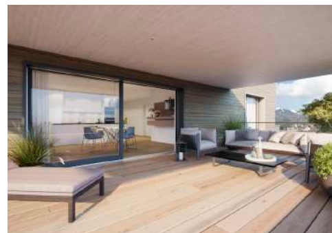
4. Mai 2020 um 12:59:20