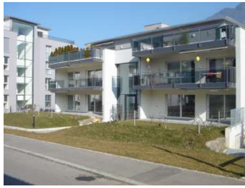
18. Februar 2008 um 12:16:41