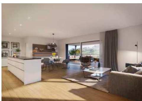
4. Mai 2020 um 12:59:49