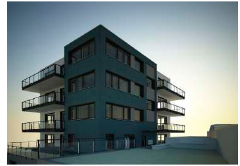
19. Juni 2013 um 11:34:57