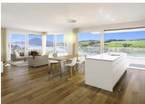
3. Januar 2018 um 19:12:43