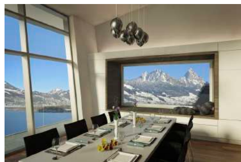
3. Januar 2018 um 19:22:10