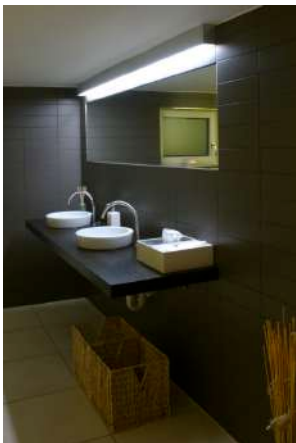
20. Mai 2007 um 22:34:18