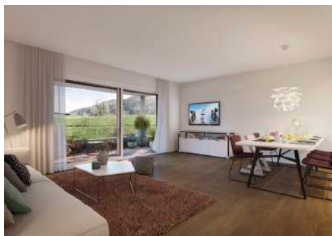
4. Mai 2020 um 12:58:56