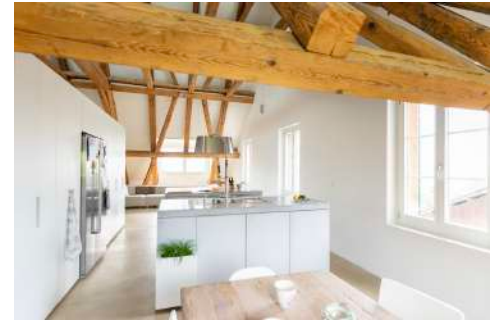
25. Juli 2019 um 15:45:18