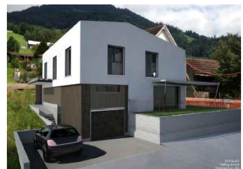
3. Januar 2018 um 19:13:57