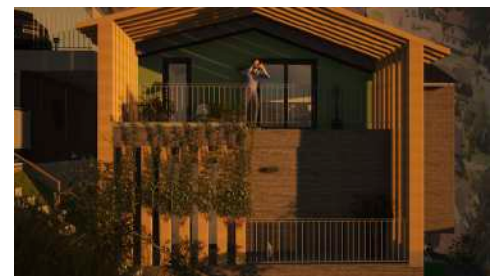
10. Mai 2020 um 19:31:40