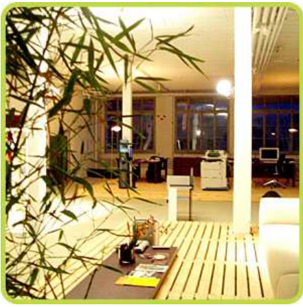
12. April 2014 um 22:31:38