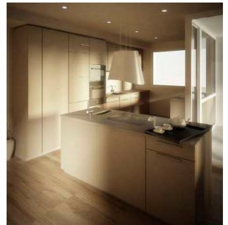
21. Januar 2013 um 15:59:48