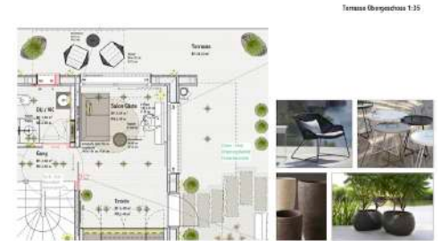
11. Oktober 2021 um 09:32:26