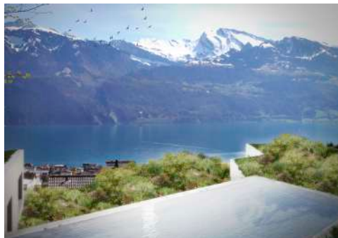
2. Juni 2015 um 08:00:03