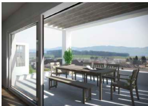
3. Januar 2018 um 19:15:19