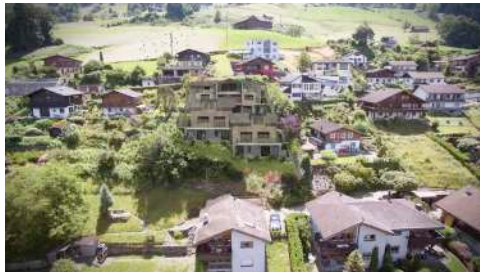
5. Juni 2017 um 16:16:44