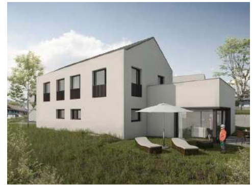
3. Januar 2018 um 19:19:03