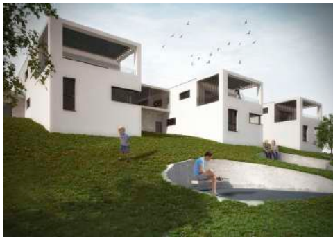
3. Januar 2018 um 19:15:30