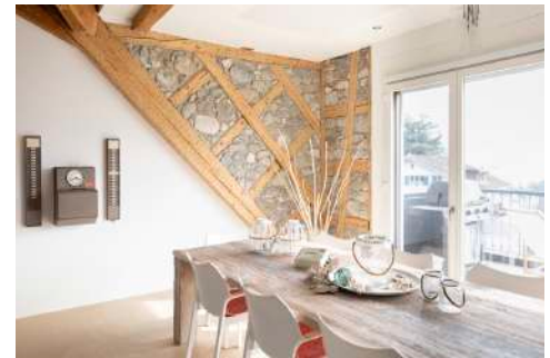
25. Juli 2019 um 16:37:06