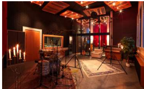
13. April 2014 um 22:34:51