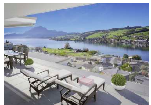
3. Januar 2018 um 19:12:56