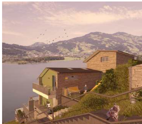
25. April 2019 um 13:33:43